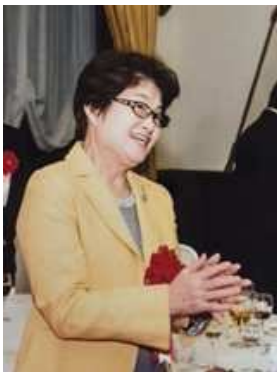
神田公園地区 60周年記念式